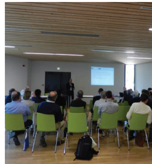
Ateliers de concertation mai et juin 2015