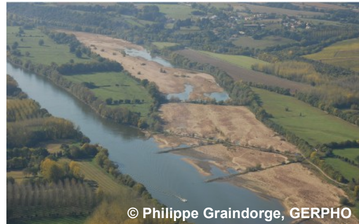
Amont du bras de Neuve Macrière commune d'Ancenis